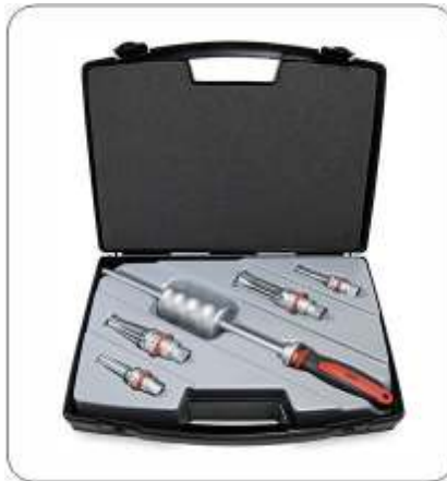
TMIP 7-28 ประกอบด้วยหัวดึง 4 ขนาด สำหรับรูใน 7 ถึง 28 มม.