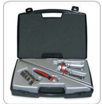
TMIP 30-60 ประกอบด้วยหัวดึง 2 ขนาด สำหรับรูใน 30 ถึง 60 มม.